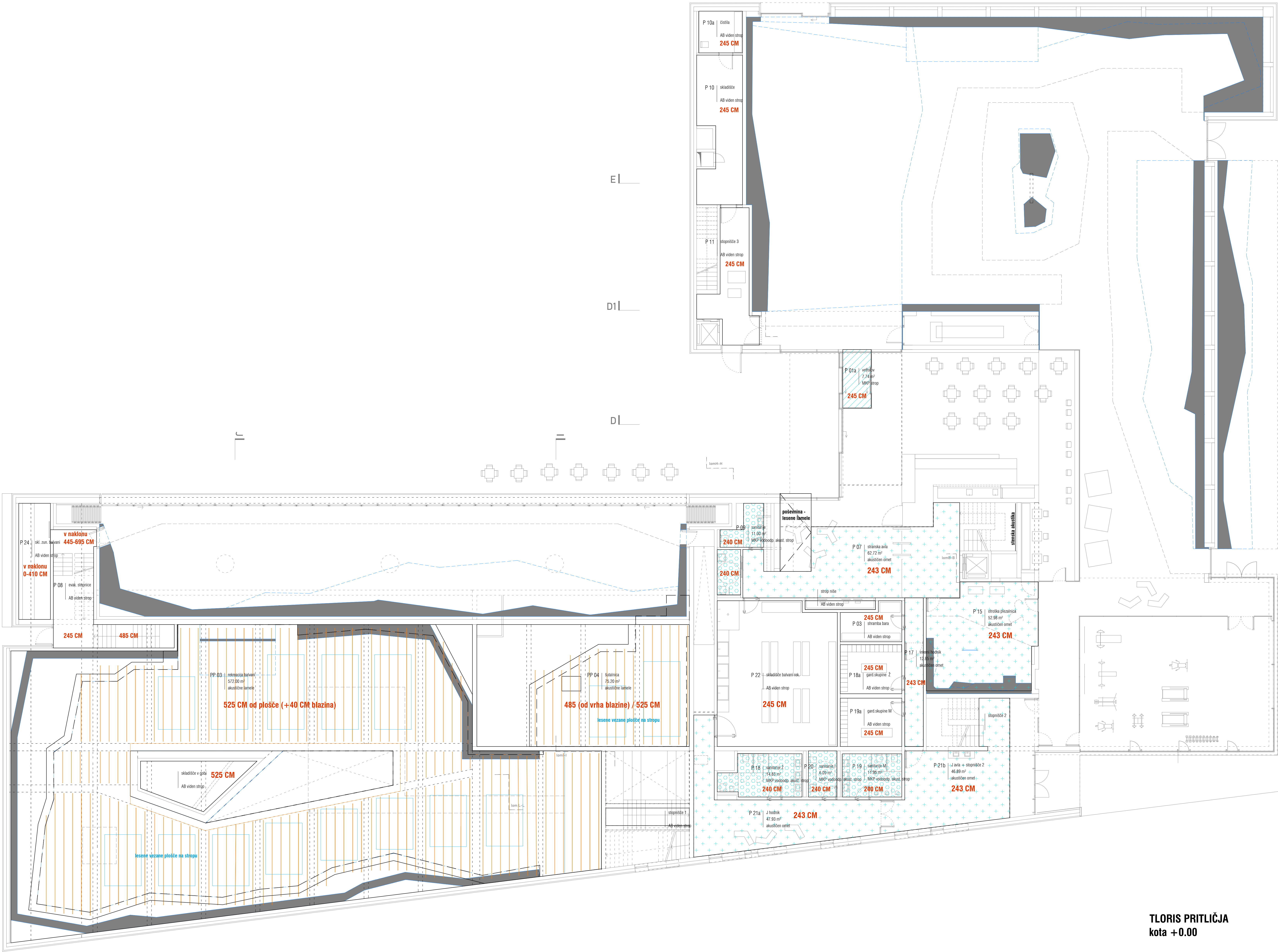
TLORIS PRITLIČJA kota +0.00